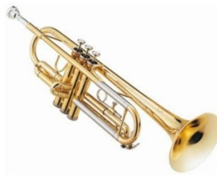
Orquesta de vientos